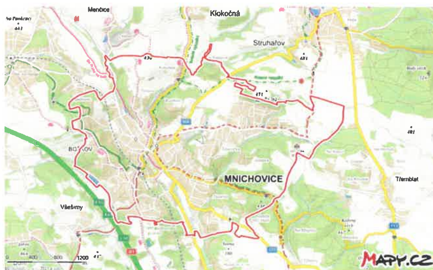
Mapa města Mnichovice, zdroj: Mapy.cz, 2021.

Město Mnichovice a jeho 3 950 obyvatel obsluhují 3 autobusové (489, 490 a 495) a 2 železniční linky (S9 a R49). Město má 3 místní části: Božkov (cca 700 obyvatel), Mnichovice (cca 3000 obyvatel) a Myšlín (cca 250 obyvatel). Váha významnosti linek je nejprve rozdělena podle počtu obyvatel v místních částech: Božkov 0,18; Mnichovice 0,76 a Myšlín 0,06.