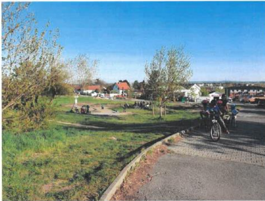
Foto z Horních Počernic 20.4.2020 v 18,00 - pro lepší představu